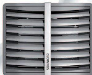
CR1 | CR2 | CR3