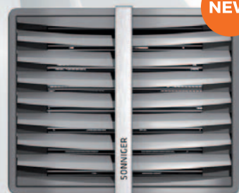
CR2 MAX | CR3 MAX | CR4 MAX